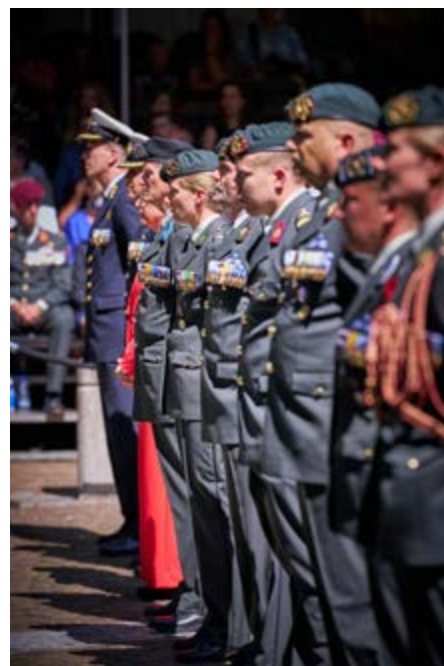
De Nationale Veteranendag is hét moment waarop Nederland zijn waardering voor veteranen laat zien.