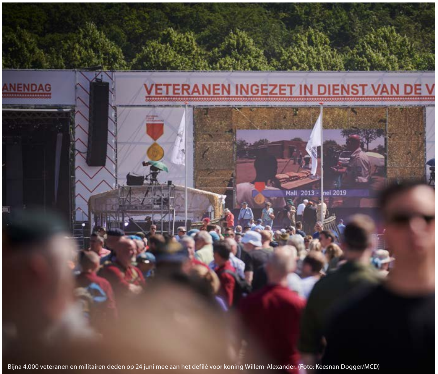
Bijna 4.000 veteranen en militairen deden op 24 juni mee aan het defilé voor koning Willem-Alexander.